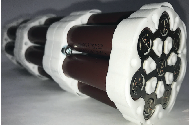
Tubular Energy System (TES), welches in das Mittelrohr des Vorderwagens diebstahtsicher integriert wird.